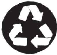
۳. بازیافت شده

عدم کیفیت یکنواخت مواد اولیه در فرآیندهای بازیافت، بایستی از پردازش مواد قبل از فرآیند استفاده کرد. در حقیقت کارخانه‌های بازیافت یعنی مجموعه‌ای از فن‌آوری‌های پردازش مواد مثل خردکن‌ها، آسیاب‌ها، غربال‌ها، جداکننده‌های مغناطیسی، سیستم‌های طبقه‌بندی هوایی و عدل‌سازها (عبدلی، ۱۳۸۵، عمرانی، ۱۳۷۴). با این توصیف، یکی از عملکردهای اصلی پیش‌فرآیندهای انجام شده بر روی مواد بازیافتی، یکنواخت‌سازی خصوصیات مواد است، مثلاً خرد کردن شیشه‌ها، اختلاط کاغذها در مخزن به همراه رطوبت و ریز کردن چوب. تعیین کیفیت مناسب مواد ورودی و پیش‌بینی محصولات، تنها پس از طراحی کامل فرآیند و بررسی شرایط اولیه ضایعات، شرایط اقلیمی و بازار موجود، ممکن خواهد بود (عابدینی، ۱۳۸۲). علامت بازیافت که به طور معمول در ایالات متحده آمریکا به کار می‌رود، دارای طرح ظریفی است. سه پیکان که به دنبال یکدیگر در یک مثلث قرار گرفته‌اند، به این معنی است که محصول از مواد بازیافت شده تولید شده، یا این که مواد این محصول قابل بازیافت است (شکل ۵-۱) (پورعلاقه‌بندان و همکاران، ۱۳۸۹، عبدلی، ۱۳۸۵).