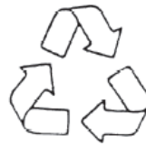
۱. قابل بازیافت