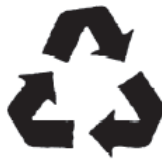
۲. بازیافت شده